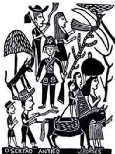
J. Borges. O Sertão Antigo . Xilogravura, s/d. Galeria Brasileira. Internet: <Researchgate.net>.

Tendo como referência inicial a imagem precedente, julgue os itens subsequentes, a respeito da cultura popular e suas linguagens artísticas.